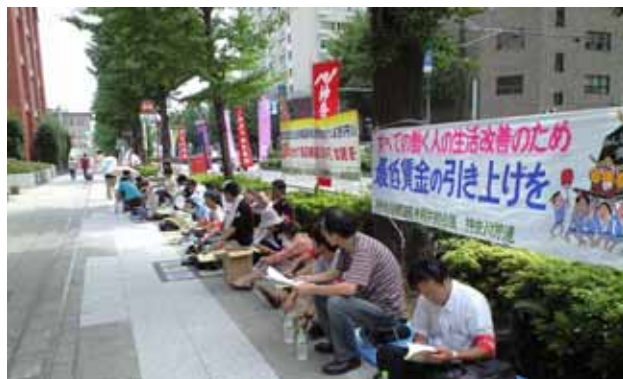
◆8月5日労働局前に座り込む神奈川のなかま 神奈川労組の職場のパート労組員も駆けつけていっしょに座り込みをしました。