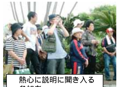
熱心に説明に聞き入る参加者