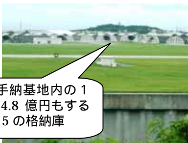
嘉手納基地内の1基4.8億円もするF-15の格納庫