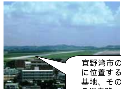
宜野湾市の真ん中に位置する普天間基地、その中を走る滑走路

朱塗りの美しい姿の世界遺産、首里城。その地下には、壕が掘られ、第32軍司令部が置かれていました。米軍の集中砲火を浴び、城は焼け落ち城壁は吹き飛ばされ、瓦礫と化しました。今はきれいに修復されていますが、...。嘉数高地から普天間基地を臨みました。宜野湾市のど真ん中に位置し周囲には19の小中高・大学があり、世界一危険な基地と言われています。アメリカ国内にはこのような基地はありません！