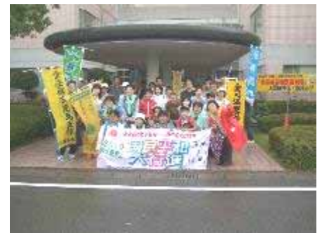
13日は再び鹿児島市に戻って谷山生協病院からスタート