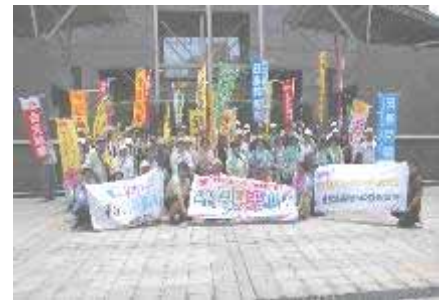
県庁で記念写真、鹿児島県の平和を願う団体が集合!

今週は鹿屋から国分、始良、伊集院方面を行進しています。来週は、串木野から川内、阿久根、出水、熊本引継ぎとなります。参加予定の方は労組室までご連絡ください。ところで、口蹄疫の関係で宮崎県では平和行進が中止になりました。鹿児島ルートも曾於市のコースは中止です。口蹄疫の1日も早い終息を願います。