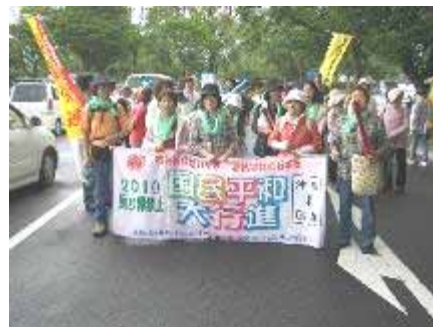
知覧から加世田市のコースには今年最大の13名が参加