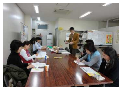
大学大阪事業連合