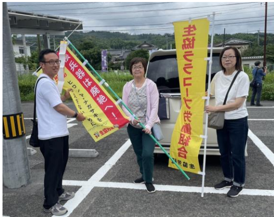
7/5、長崎から佐賀に引き継ぎました。